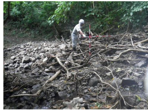
玉川林道(土砂堆積)