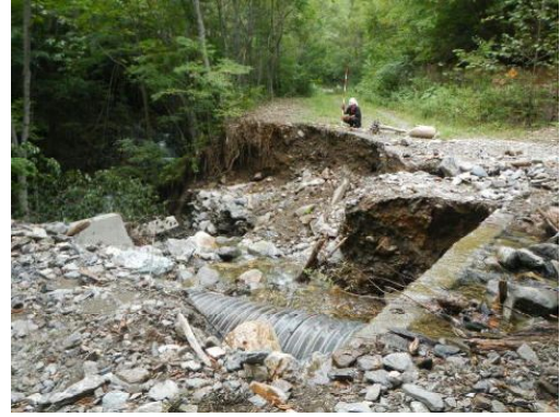
大堀内林道(路体流出)