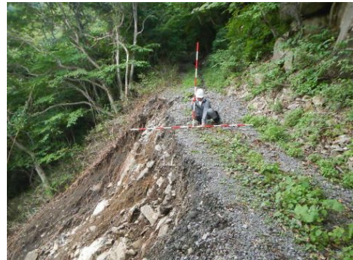
内間木沢林道(路肩欠壊)