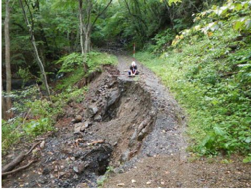
松ヶ沢林道(路面欠壊)