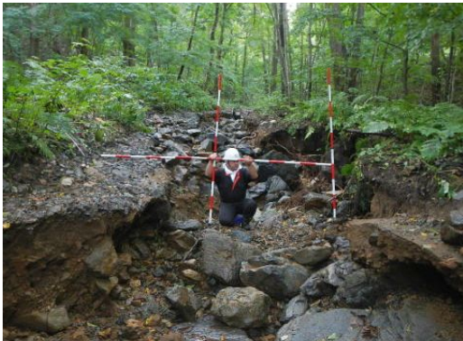
明神林道(路面洗掘)