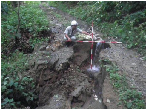
野田林道(路面洗掘)