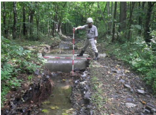
野田林道(路面洗掘)