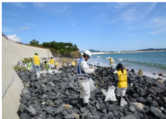
(ゴミの分別・収集作業)