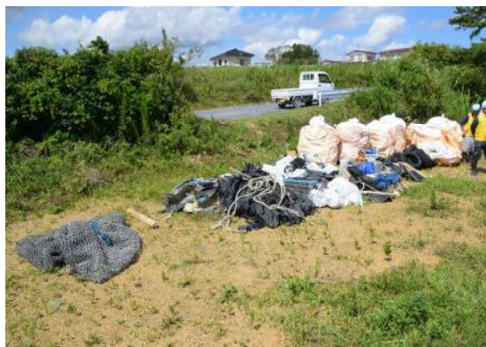
(回収した漂着ゴミ トンパック10袋)