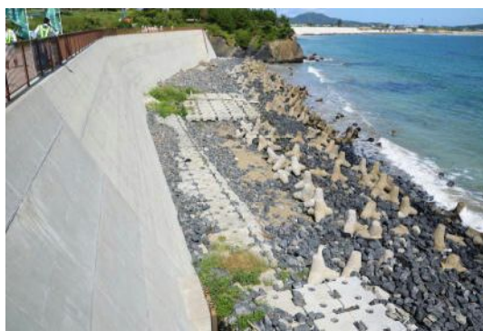
(ゴミ回収が終わり綺麗になった野々下海岸)