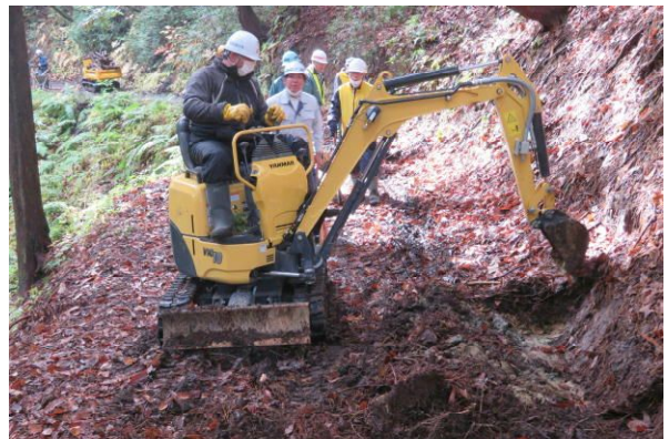
ミニバックホウによる掘削作業