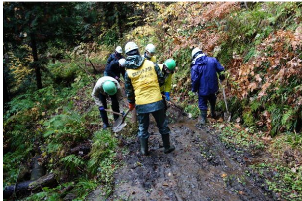
排水施設の土砂除去作業