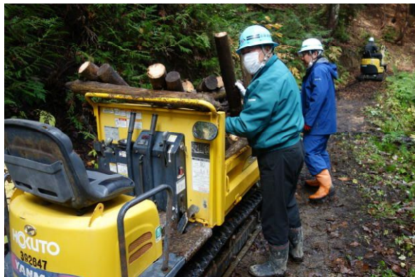
運搬車による搬出