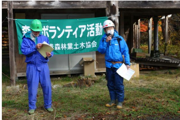
説明する岸野森林技術指導官