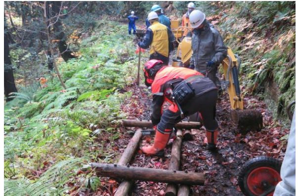
チェーンソーによる切断作業