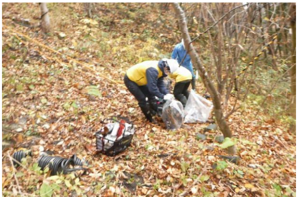
斜面から様々なゴミを収集