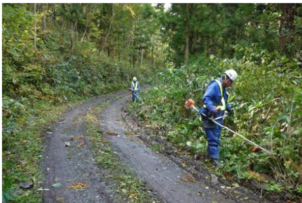
奥州市：西根林道での草刈り作業