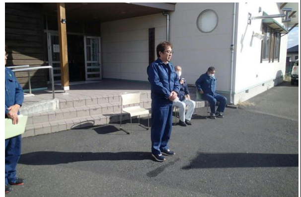
挨拶される添谷署長