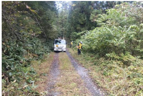
一関市：大仁田林道での草刈り作業