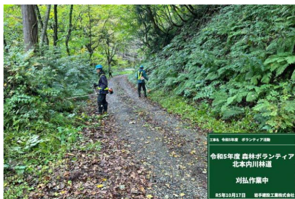
北上市：北本内川林道での草刈り作業